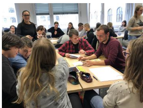
Dijaki in študenti pri delu.

V ponedeljek, 10. decembra 2018, smo na Oddelku za geografijo FF UL izvedli delavnico s tematiko zelene infrastrukture za srednješolce Srednje gradbene, geodetske in okoljevarstvene šole iz Ljubljane. V celoti smo jo organizirali študenti prvega in drugega letnika magistrskega študija geografije, in sicer v sklopu predmeta Razvojna neskladja na podeželju.