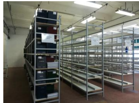
Preseljene diplome in seminarske naloge (foto: S. Jontez).