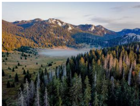
Veliki Lubenovac v Narodnem parku Severni Velebit.

Pri Znanstveni založbi filozofske fakultete je izšla monografija z naslovom Dinarski kras: Severni Velebit. V njej so objavljeni rezultati večletnih raziskav sodelavcev Oddelka za geografijo Univerze v Ljubljani in Oddelka za arheologijo Univerze v Zadru. Monografija obravnava geografsko, kulturno, zgodovinsko, geomorfološko, glaciološko, naravovarstveno in vegetacijsko problematiko Severnega Velebita. Celotna odprtodostopna publikacija je dosegljiva na portalu E-knjige: https://e-knjige.ff.uni-lj.si/znanstvena-zalozba .