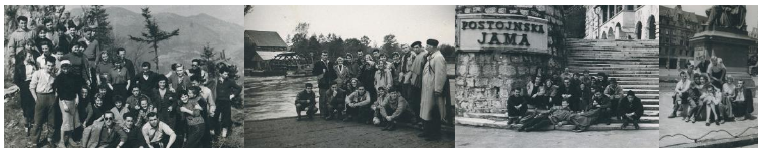
Bruci na prvi ekskurziji, 1956; Brod na Muri, 1958; Pred Postojnsko jamo, 1958; 2. letnik v Wrocławu.