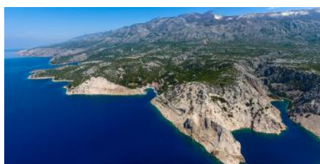
Velebitsko podgorje z zalivom Zavratinica.

Pri Znanstveni založbi filozofske fakultete je izšla monografija z naslovom Dinarski kras: Severni Velebit. V njej so objavljeni rezultati večletnih raziskav sodelavcev Oddelka za geografijo Univerze v Ljubljani in Oddelka za arheologijo Univerze v Zadru. Monografija obravnava geografsko, kulturno, zgodovinsko, geomorfološko, glaciološko, naravovarstveno in vegetacijsko problematiko Severnega Velebita. Celotna odprtodostopna publikacija je dosegljiva na portalu E-knjige: https://e-knjige.ff.uni-lj.si/znanstvena-zalozba .