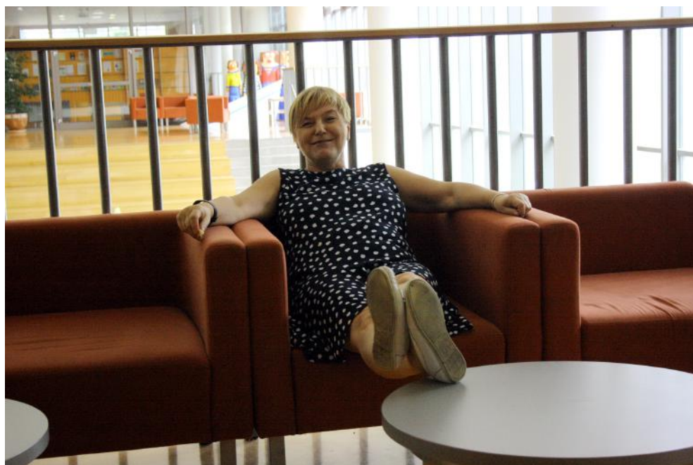
Oddelčna šefica.