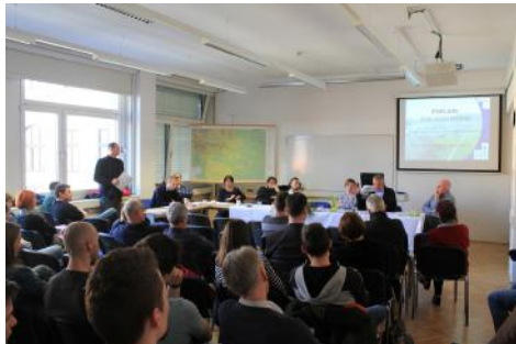
Udeleženci in govorcji na dogodku.